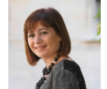
Francina Armengol i Socias Presidenta CAIB 26/10/17