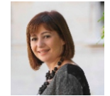
Francina Armengol i Socias Presidenta CAIB 26/10/17