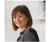
Francina Armengol i Socias Presidenta CAIB 26/10/17